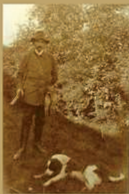
„Boncoeur“ Bildarchiv Hans Eggerts