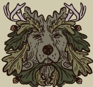
Zwinger v.d. Eiseneiche