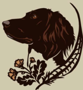
v.d. WILDBLUMEN KLEINE MÜNSTERLÄNDER