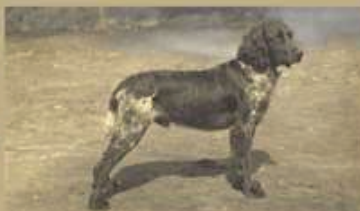
„Becass“ Edmund Löns