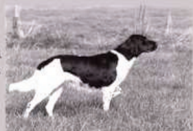
„Tessa vom Westfalenland“