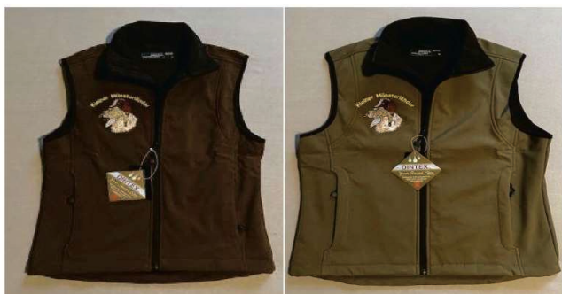
Womens & Men's Vest

You can find many more products in our online store!