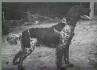
„Bingo“ Edmund Löns