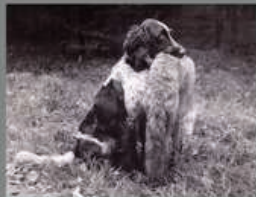
„Annette von der Schwanenstadt“