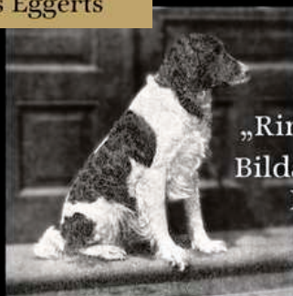
„Rino Hervest“